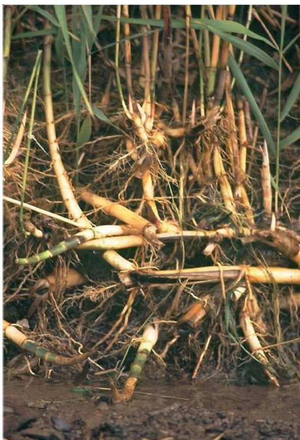
Rhizoomnetwerk van Phragmites Australis (riet)