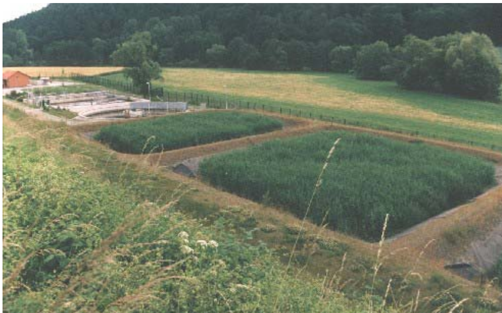
Slibveraardings-installatie Naumburg (D), deelvelden 1 en 2 (2.400 m 2 brutooppervlakte, groeihoogte tot 4 m, stengeldichtheid tot 320 stuks per m 2 . Aktiefslib installatie op de achtergrond)

De riet-bassins worden, naar gelang de inrichting van de installatie, om de 8 tot 12 jaar geruimd en aansluitend opnieuw opgestart en geëxploiteerd. Afhankelijk van het gebruiksdoel, kan het veraarde slib dan nagecomposteerd worden, direct in de landbouw ingezet of verbrand worden. Ook kan het eindproduct in de tuin-aanleg of landschapsinrichting ingezet worden.