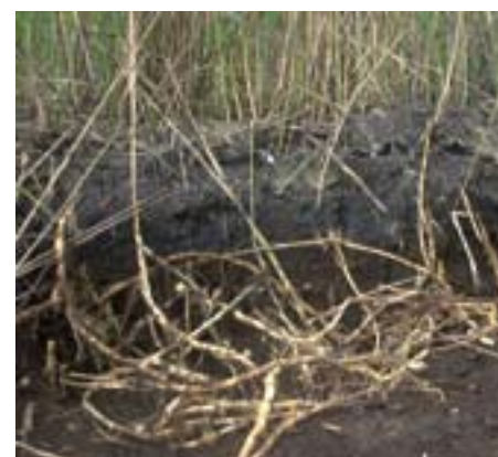
► Zicht op de doorsnede van het ontwaterd slib met de wortels van de rietplanten (rhizomen)

De secundaire belasting van de zuiveringsinstallatie door filtraatwater is tegenover conventionele ontwateringstechnieken belangrijk lager. Het is bovendien mogelijk om de slibontwatering het gehele jaar door plaats te laten vinden. Na ruiming kan een deelbekken weer in gebruik genomen worden, zonder dat arbeidsintensief herplanten van het riet nodig is: de rietplanten ontwikkelen zich namelijk telkens opnieuw vanuit de diepliggende rhizomen. De ruimingsfrequentie is afhankelijk van de installatie en wordt bepaald door de basindiepte. Het nacomposteren van het veraaarde slib kan in of buiten de bassins plaatsvinden. Het tijdstip van ruiming is flexibel te kiezen. Het eindproduct wordt gekenmerkt door een drogestofgehalte van meer dan 40% en de inzet van toeslagstoffen is niet nodig.