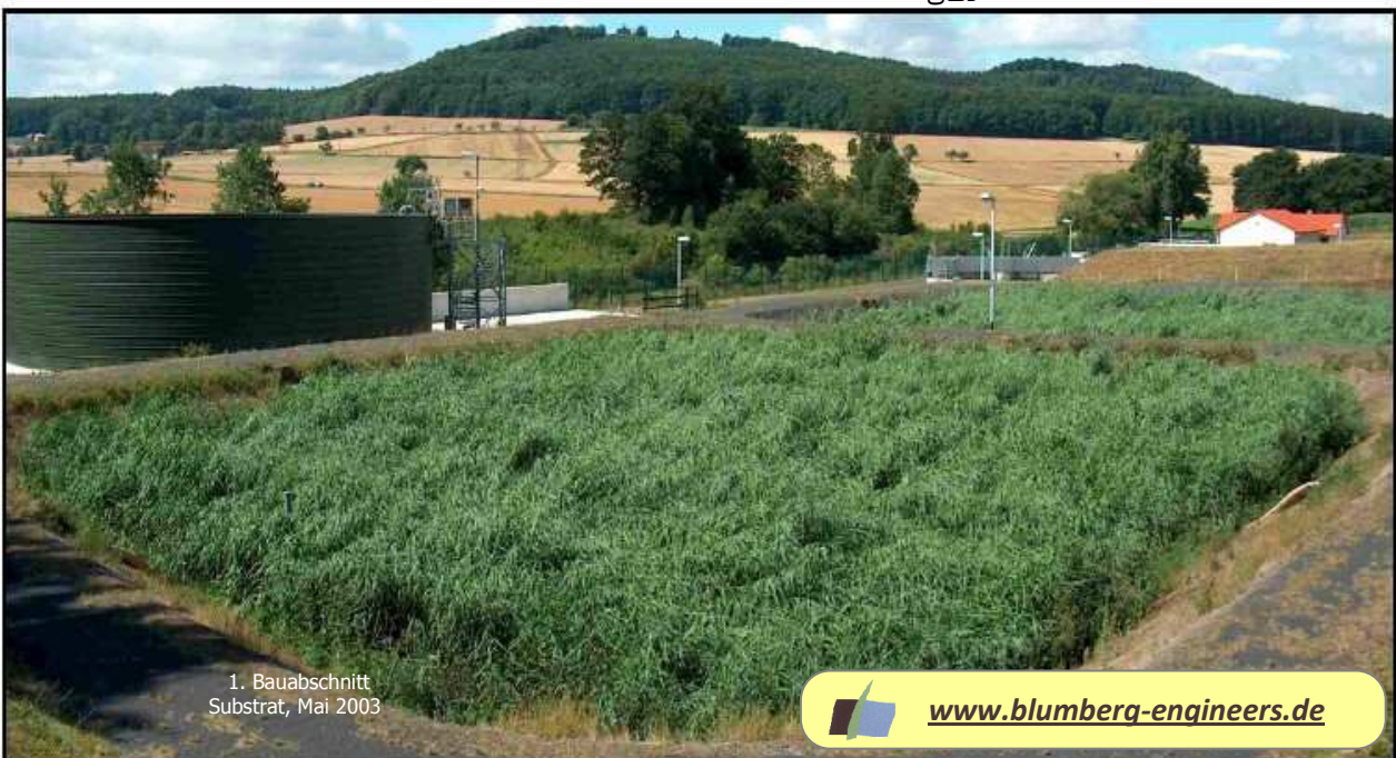
1. Bauabschnitt Substrat, Mai 2003