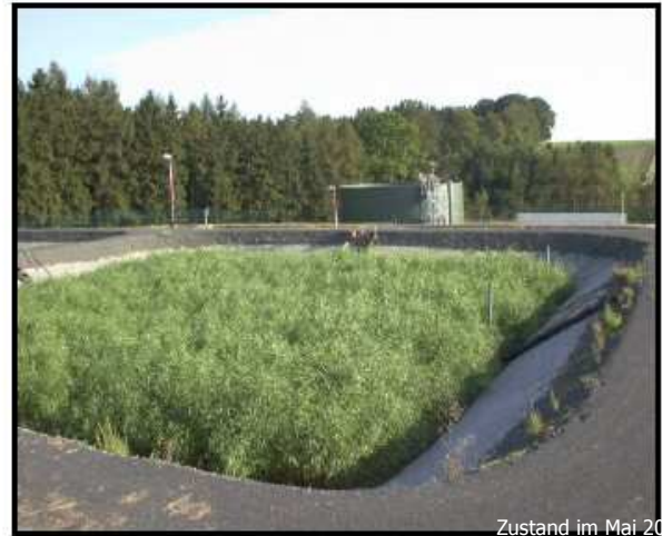
Zustand im Mai 2003

تصفیه گل و لای اضافی تصفیه خانه فاضلاب از طریق فعال سازی لجن ها همزمان با تثبیت آنها و حذف فسفر بیولوژیکی و حوضچه ازت دهی .